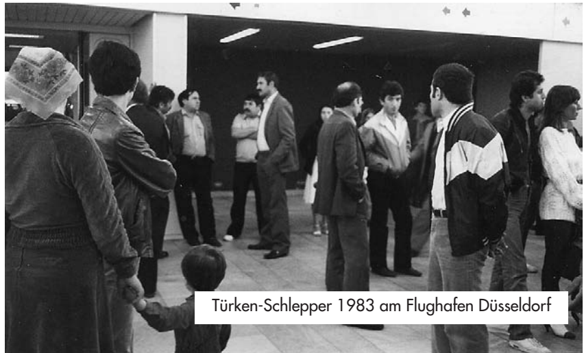
Türken-Schlepper 1983 am Flughafen Düsseldorf